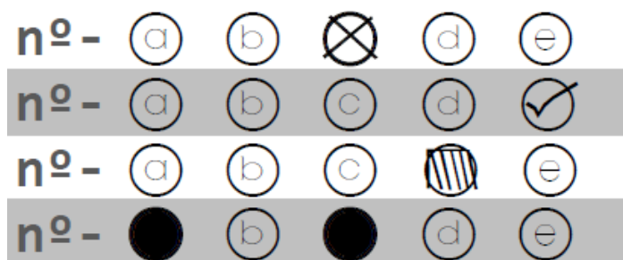
Figura 03 - preenchimento INCORRETO;

a. O candidato não poderá assinalar com “X”, “ticar”, “achurrear”, “traçar”, marcar mais de uma alternativa por questão, ou fazer qualquer marcação que não a indicada como correta no item anterior, nem ultrapassar na marcação as linhas do círculo.